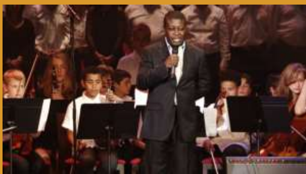
Armand Diangienda - Casino Paris 2012

L'aventure incroyable des Petites Mains Symphoniques avec nos amis Africains a commencé dès 2012 avec la présence d'Armand Diangienda, créateur de Kinshasa Symphony Orchestra, au Casino de Paris. Puis s'est poursuivi en 2018 avec un concert improbable en Côte d'Ivoire pour France Television (émission de Michel Drucker) et s'est concrétisée par la création de l'association des Petites Mains Symphoniques au Gabon en octobre 2019 grâce à son Ministre d'Etat.