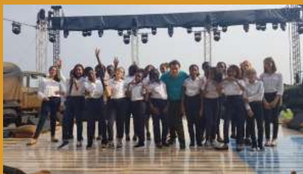
Côte d'Ivoire 2018 - France Télévision

https://www.youtube.com/watch?v=MWoj4t_PFOs#t=4m06s